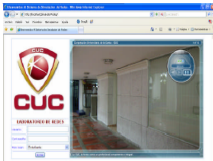
Página de Acceso a la Aplicación WEB