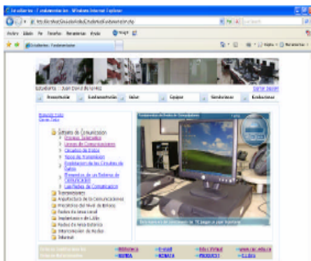
Página Fundamentación :: Usuario Estudiante