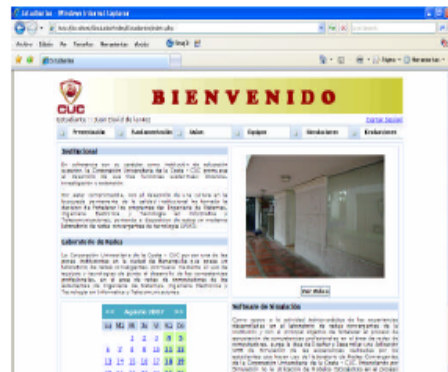
Página Presentación::Usuario Estudiante