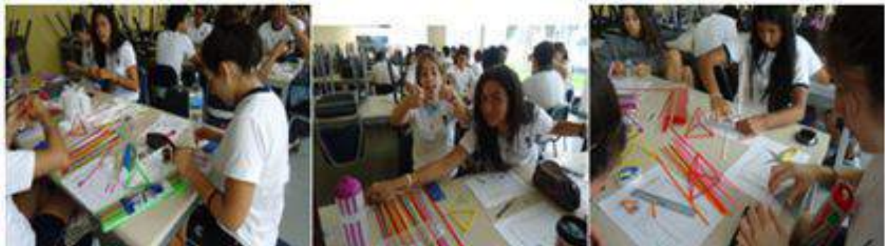
Figura 3. Estudiantes durante la construcción de la estrella icosaédrica.

A continuación algunas fotografías de los estudiantes participantes: