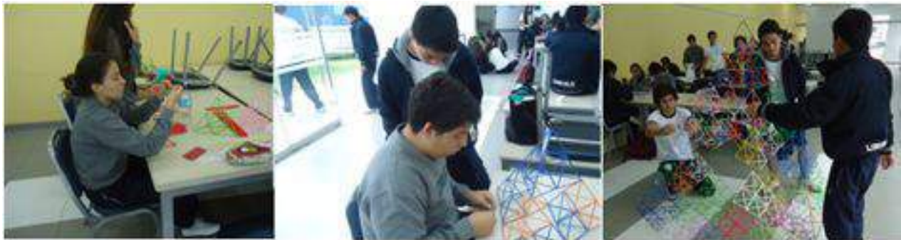
Figura 4. Estudiantes durante la construcción del tetraedro de Sierpinski

A continuación algunas fotografías de los estudiantes participantes: