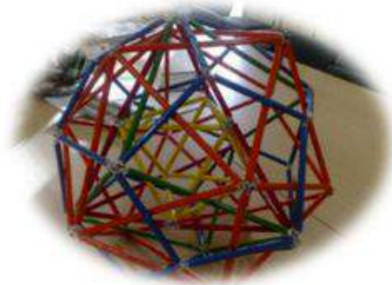
Figura 2. Omnipoliedro.