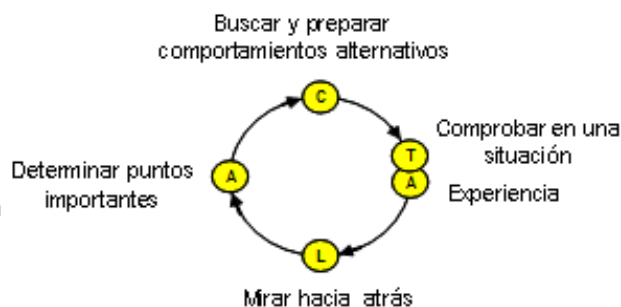
Figura 15. Modelo ALaCT (Korthagen, Kessel, Koster y Wubbels, 2001)

Dentro de los modelos utilizados en educación matemática, hemos seleccionado uno surge desde la psicología cognitiva (Korthagen y Verkuyl, 1987). Nos referimos al modelo reflexivo ALaCT de Korthagen. Este autor describe el proceso destinado al aprendizaje reflexivo, al que denomina proceso ALaCT , como un proceso cíclico en el que se pueden distinguir cinco etapas o fases.