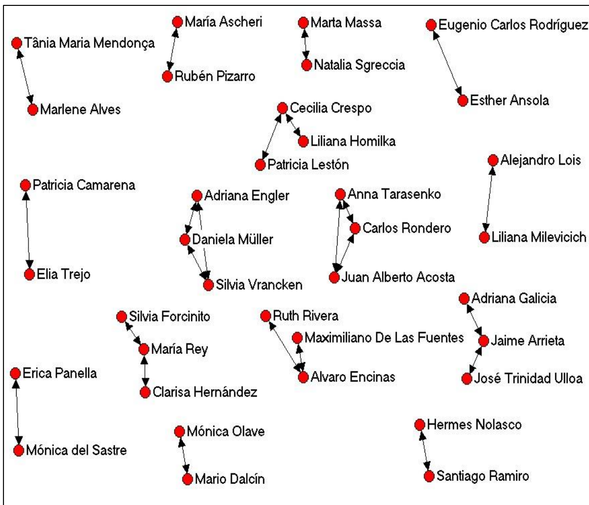
Figura 2: Red social de colaboración autorial

Al aplicar el análisis de redes sociales al estudio y visualización de la colaboración autorial se observa que la mayor cantidad de colaboraciones en la revista se realiza entre pares de autores (Figura 2).