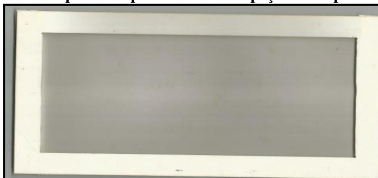
Figura 2: Peças das frações Experimentoteca