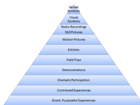
Imagen1 : Cono del aprendizaje. Dale. (1969)

El cono del aprendizaje de Dale (1969) proviene de un estudio que realizó analizando la significatividad de diversos elementos audiovisuales. En él propone una interesante reflexión sobre la adquisición de contenidos vinculandola a la forma en la que son transmitidos. De forma lógica, plantea que cada banda no debe considerarse rígida e inamovible, puesto que será diferente para cada persona