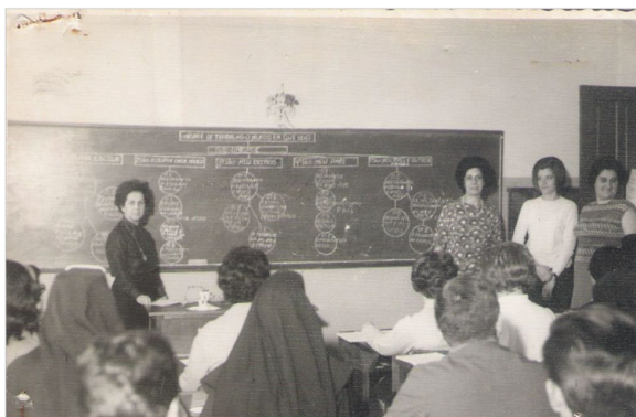
Figura 2. Curso de Matemática Moderna - Colégio Augustinho Pereira