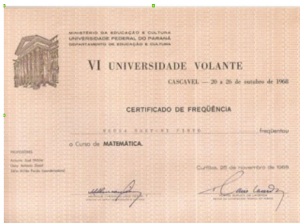
Figura 1. Certificado do curso de capacitação e aperfeiçoamento

Em 1965, uma iniciativa da Universidade Federal do Paraná promoveu a realização de cursos de capacitação e aperfeiçoamento para professores da região oeste do estado. Sediada na cidade de Cascavel, dentre os cursos oferecidos pela Universidade Volante destaca-se o Curso de Matemática, ministrado pelo Professor Osny Antonio Dacol, que abordou a Matemática Moderna ensinando os professores do Curso Ginásial a trabalharem com os Blocos Lógicos (figura 1).