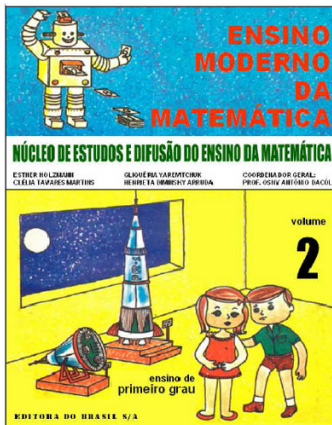
Figura 4. Capa Livro do NEDEM para o Primário - Volume 2 (Nedem, 1971)

nas capas das edições para os anos iniciais de escolaridade, imagens que fazem alusão ao desenvolvimento tecnológico que era vivido naquela época; além das imagens e dos textos introdutórios que evidenciam o progresso da tecnologia, desenhos de foguetes e robôs são marcas das publicações didáticas que foram produzidas por seus membros para uso nas escolas.