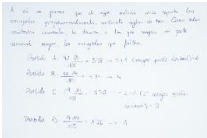
Figura 6. Propuesta del grupo 2