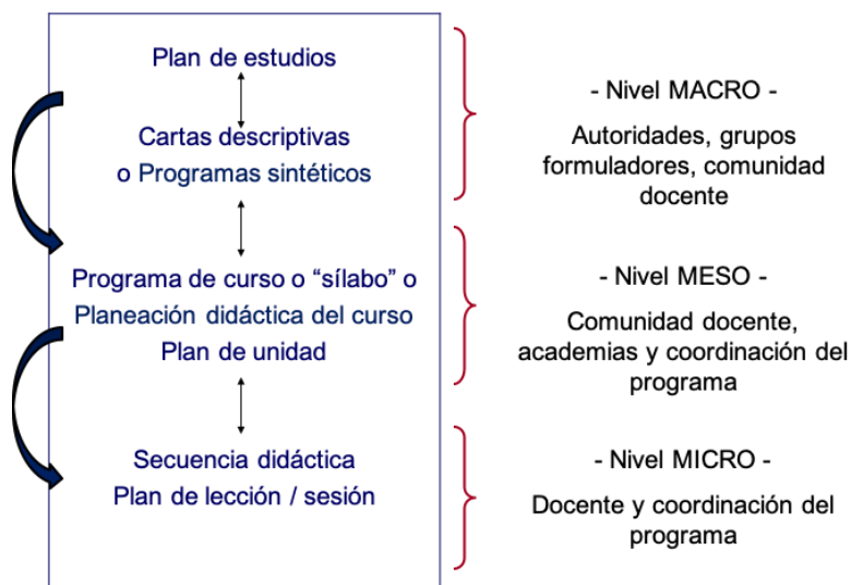
Figura 2. Niveles de concreción del diseño curricular

El nivel meso los diferentes actores intervienen en el diseño en lo extenso del programa (o asignatura), el cual generalmente está constituido por los siguientes elementos: