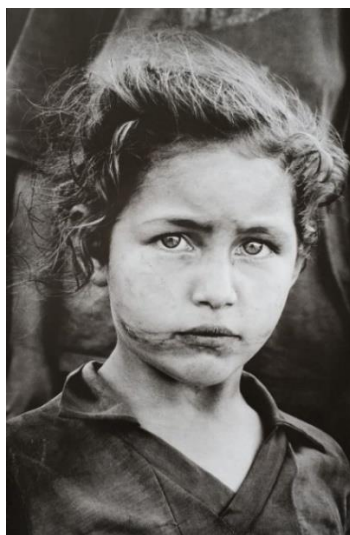
Figura 1 – Fotografia do livro “Terra”

Esse livro possui 109 fotografias em preto e branco, que foram feitas entre 1980 e 1996. Essas fotos retratavam a condição de vida de trabalhadores rurais Sem Terra, crianças e mendigos, além de outros grupos excluídos socialmente, marginalizados e desterrados no Brasil. Na Figura 1, temos uma das fotografias do livro “Terra” que faz parte da exposição.