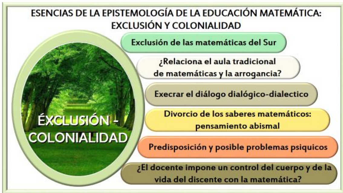
Figura 2: Elaboración del Autor

Se resume el presente rizoma la Figura 2 siguiente. En donde se narra la esencia de la epistemología de la Educación Matemática que se ha venido mostrando como excluyente y colonial en el paradigma de la modernidad. Se explicitan preguntas importantes a tomar en cuenta en la problemática; entre ellas el divorcio entre los saberes matemáticos.