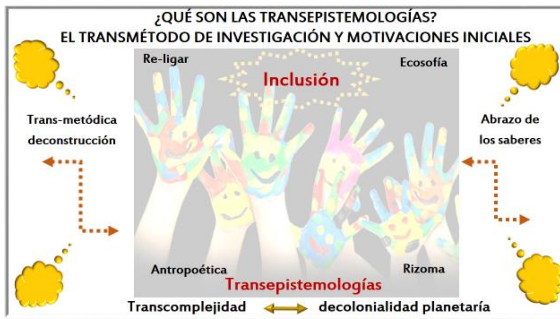
Figura 1: Elaboración del Autor

Se realiza la Figura 1 a fin de presenta el presente rizoma en cuanto a su transmétodo y como se configura en la investigación. En la figura se narra como el transmétodo va a deconstruir en un marco decolonial planetario que se permite la aceptación y ejercicio de la transcomplejidad, donde el re-ligar, la ecosofía, y la antropoética conjugan el objeto complejo de estudio.