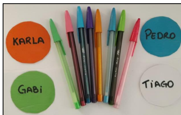
Figura 2: Atividade experimental com os quatro nomes e as oito canetas

Após a primeira proposta, realizada pelo participante da entrevista, o entrevistador realizava alguma modificação na situação: algumas vezes deixava algum dos personagens sem qualquer caneta, noutras concentrava todos os objetos em um único. A cada movimento das canetas, os participantes eram questionados acerca da média que poderia ser encontrada e de possíveis mudanças, sem alterar a média de duas canetas por pessoa. Durante a atividade experimental, os participantes também manipulavam os objetos, a fim de representar as diferentes situações propostas.