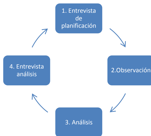
Figura 1. Gráfico del ciclo de mejora

En la fase 1, entrevista de planificación, cada mentor se entrevista con los noveles a su cargo y los informa del plan de asesoramiento: objetivos, acciones, observaciones, análisis, bibliografía aconsejable y temporalización. En la fase 2, observación, el profesor mentor observa la clase impartida por el novel, siendo opcional la grabación en video para su posterior análisis. En la fase 3, análisis, se emplean instrumentos de análisis proporcionados a los profesores mentores, que van dirigidos a analizar las siguientes cinco dimensiones de la práctica en el aula: