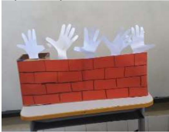
Figura 4: Experiência da professora G com sua turminha de 5 anos

alunos atividades que propiciem aprendizagens significativas em matemática. Foram momentos interessantes de formação continuada de professores desenvolvida no grupo de estudo GEEM-ES, em que todos nós compartilhamos conhecimentos, assim como ideias, para trabalharmos com nossos alunos a educação matemática de forma significativa.