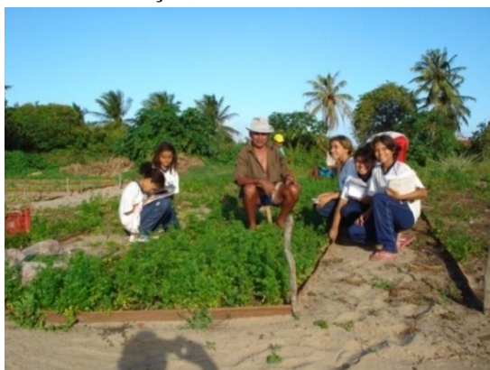
Figura 1. Alunos do 5º ano da Escola Mun. Profª. Lourdes Godeiro entrevistando um dos horticultores da comunidade de Gramorezinho.

Após esses esclarecimentos ao leitor, vou adentrar no contexto da ação pedagógica realizada com os alunos do 5º ano do ensino fundamental da escola daquela comunidade. Vale salientar que nem todos aqueles alunos trabalhavam com hortaliças ou tinham pais horticultores. Então, foi necessário levá-los a visitar as hortas da comunidade, como mostra um desses momentos a Figura 1, com o objetivo de observar os afazeres diários dos horticultores com o manuseio das hortaliças, além de entrevistá-los.