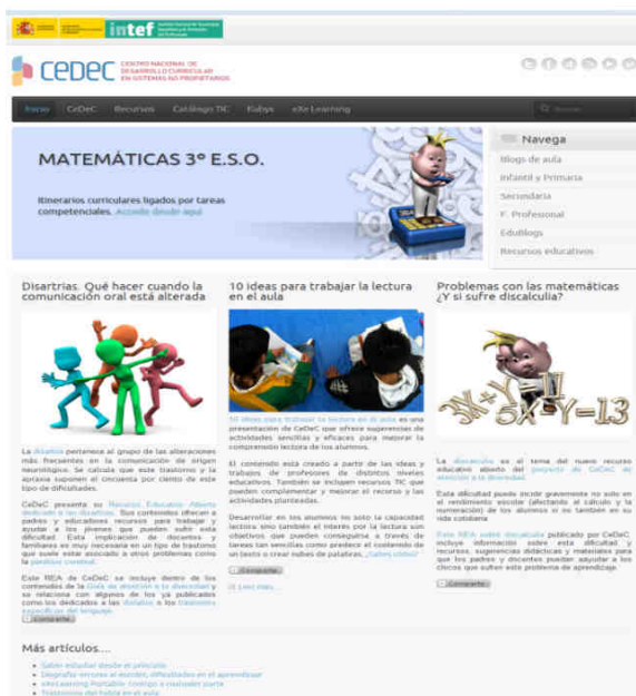
Figura 1. Página inicial

Para entender el funcionamiento de esta página web se procede primero a explicar la estructura y organización que presenta. La página de inicio (figura 1), contiene un encabezado con acceso a diferentes recursos, e incluye también un buscador. En la parte central encontramos un slider de imágenes con accesos a los contenidos de la propia web. Además, en la parte inferior se presentan tres columnas con presentaciones de los recursos educativos más recientes, y más abajo, el enlace para acceder al resto.