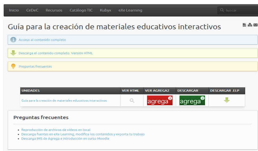
Figura 6. Página de descarga de contenidos

Al acceder a cualquiera de los recursos, las secciones de descarga tienen diferentes opciones, acceder al contenido completo, descargarlo, y preguntas frecuentes. Además también existe la posibilidad de previsualizar las distintas unidades a descargar, descargarlas, imprimir en PDF, imprimir, o bien, enviarlas por correo electrónico (figura 6).