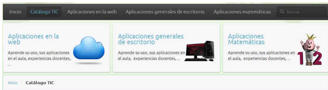
Figura 7. Página de Catálogo TIC

La sección “Catálogo TIC” se nos presenta dividida en tres partes (figura 7): aplicaciones en la web; aplicaciones generales de escritorio y aplicaciones Matemáticas.