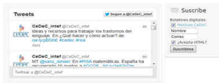
Figura 3. Apartado inferior de la página inicial

Refiriéndonos más a la parte técnica, la web creada sigue una plantilla muy sencilla, típica en la red, pero cabe destacar que esta página se carga en muy pocos segundos y que el contenido es fácil de visualizar y legible, manteniendo por tanto a los visitantes en conexión. Además, todos los enlaces e imágenes funcionan correctamente. El propósito del sitio web está claramente visible y la web funciona perfectamente en los navegadores más comunes como Internet Explorer, Mozilla Firefox y Google Chrome. El único “pero” de la parte técnica de la web es que el buscador no funciona con mucha eficacia y rapidez.