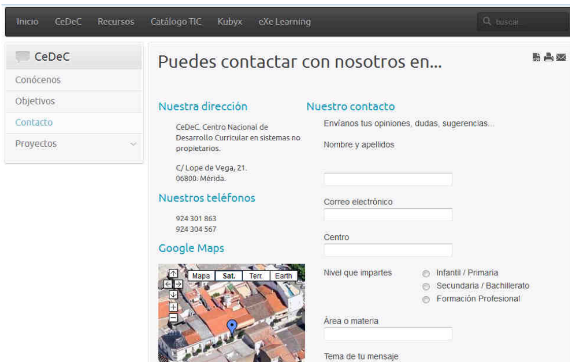
Figura 4. Página de contacto

En esta sección se tiene también la información de contacto, dirección, teléfonos, imagen de Google Map con la ubicación, y un formulario para enviar opiniones, dudas, sugerencias... (figura 4).