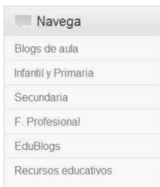
Figura 2. Secciones

Por último, en la parte inferior de la página encontramos los comentarios más recientes hechos en Twitter y justo al lado, el pequeño formulario para suscribirse (figura 3).