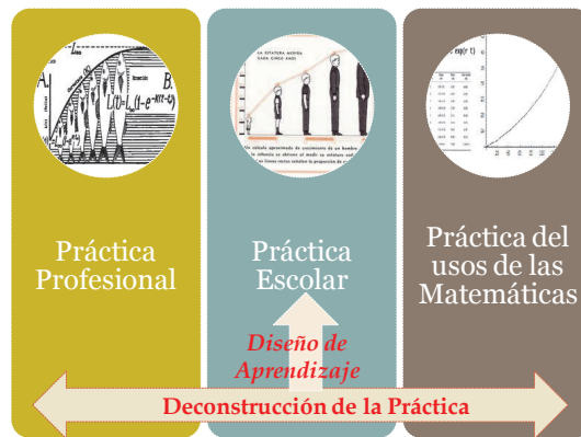
Figura 2: La deconstrucción como sustento de diseños de aprendizaje

El diseño didáctico es básicamente el plan desde el cual el sujeto del conocimiento, el que aprende, es decir el estudiante, se apropia del objeto que va a conocer.