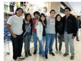
Estudiantes de UNAM participaron con el Club dando conferencias motivacionales