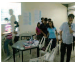
Curso diseñado por la facultad de matemáticas sobre modelación.