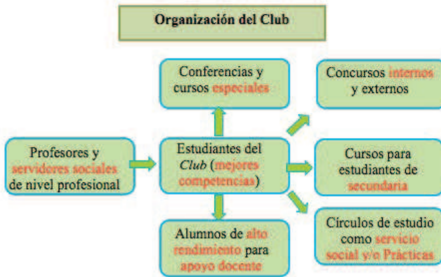
Figura 3. Organización del Club y sus acciones inmediatas.

Estas y otras más perspectivas se piensan trabajar a futuro considerando los elementos principales de la escuela y su comunidad, ver figura 3 .