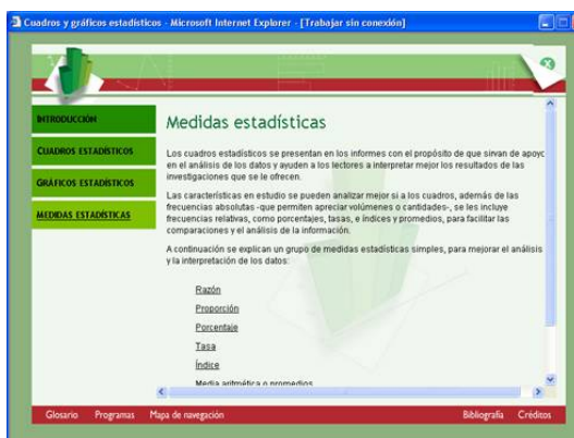
Figura 1.7 Medidas Estadísticas: pantalla para el usuario.

En la siguiente pantalla se pueden observar, los botones que permiten la navegación del usuario, el acceso de los ejemplos y a las lecturas complementarias: