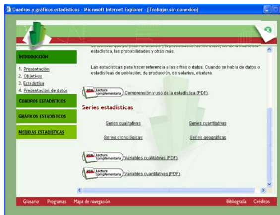
Figura 1.4 Introducción: pantalla para el usuario (Continuación).