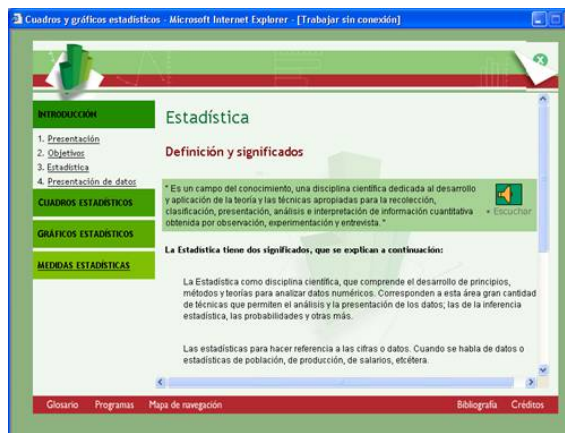
Figura 1.3 Introducción: pantalla para el usuario.