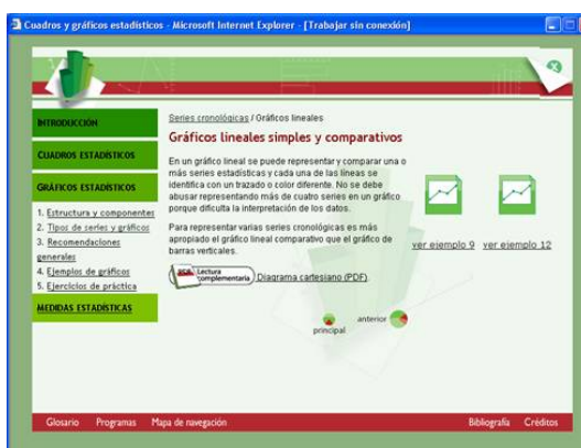
Figura 1.8 Botones de navegación, ejemplos y lecturas complementarias para el usuario.

En la siguiente pantalla se pueden observar, los botones que permiten la navegación del usuario, el acceso de los ejemplos y a las lecturas complementarias: