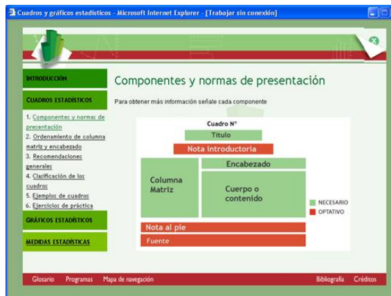
Figura 1.5 Cuadros Estadísticos: pantalla para el usuario.