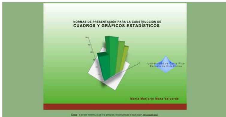
Figura 1.1 Metáfora.