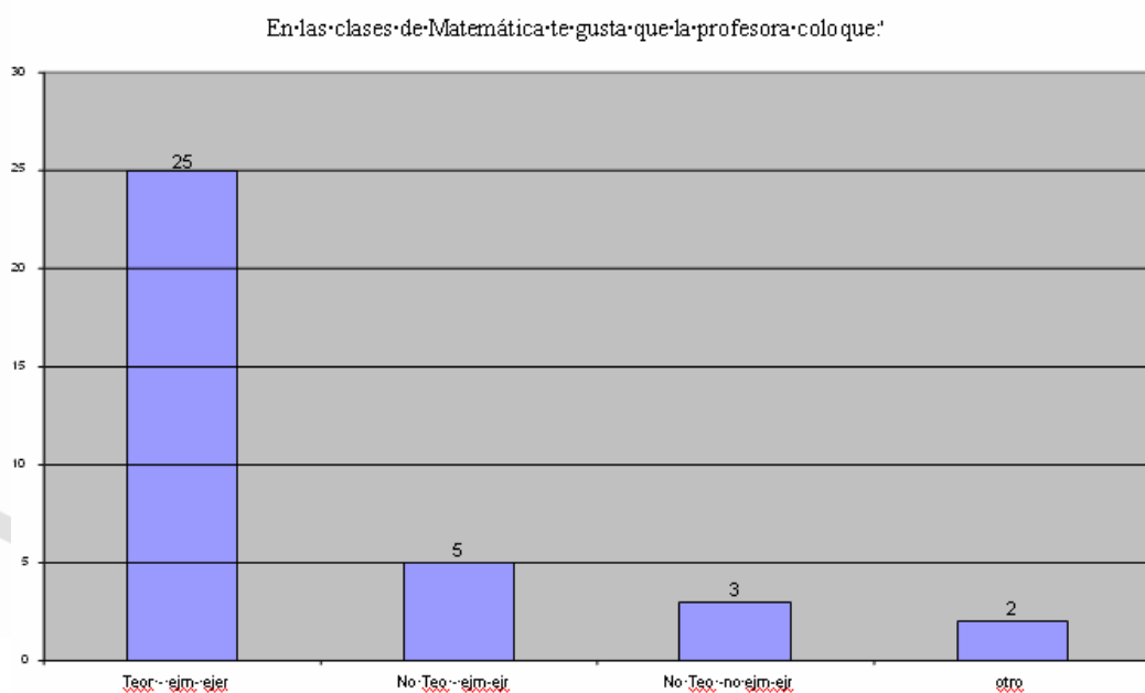
Gráfico 3. Opinión de los alumnos respecto a la secuencia de las clases del pasante B (Parra, 2004)

La total coincidencia en la secuencia de actividades por parte de los pasantes y los alumnos contó con el apoyo de la profesora colaboradora, quien a través de la corrección de las planificaciones de los pasantes ratificaba su conformidad con ella. De igual manera, los alumnos apoyaban el hecho de que fuera el pasante –en su papel docente– quien ofreciera la teoría acompañada de un ejemplo, quedando para los alumnos la responsabilidad de la realización de ejercicios y problemas.