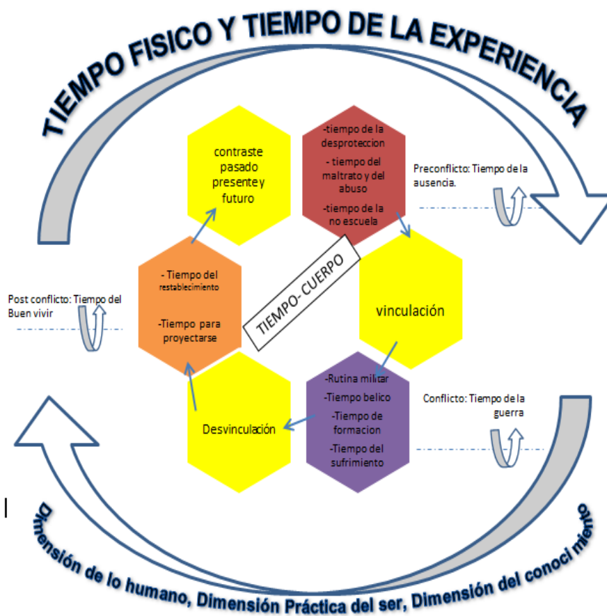
Diagrama 2. Tiempo y temporalidad en la experiencia del niño desvinculado. Construcción propia.

Se ha encontrado que el tiempo y la temporalidad se organizan de tres maneras distintas en las narrativas de los niños desvinculados. El siguiente esquema representa los hallazgos.