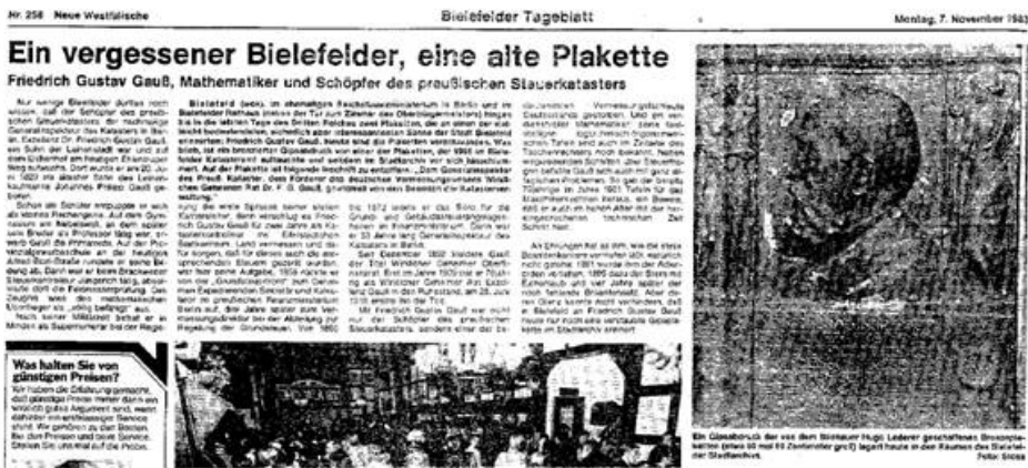
Figura 9: artigo na “Neue Westfälische”, 7.11. 1983.