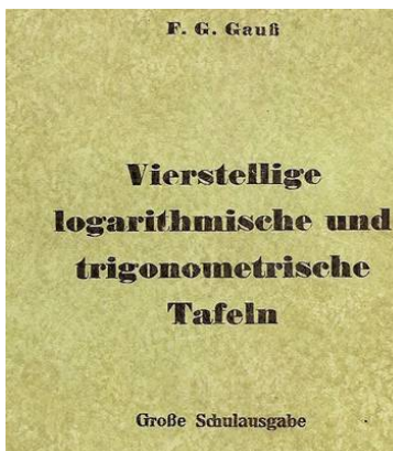
Figura 1. Folha de rosto da tábua.