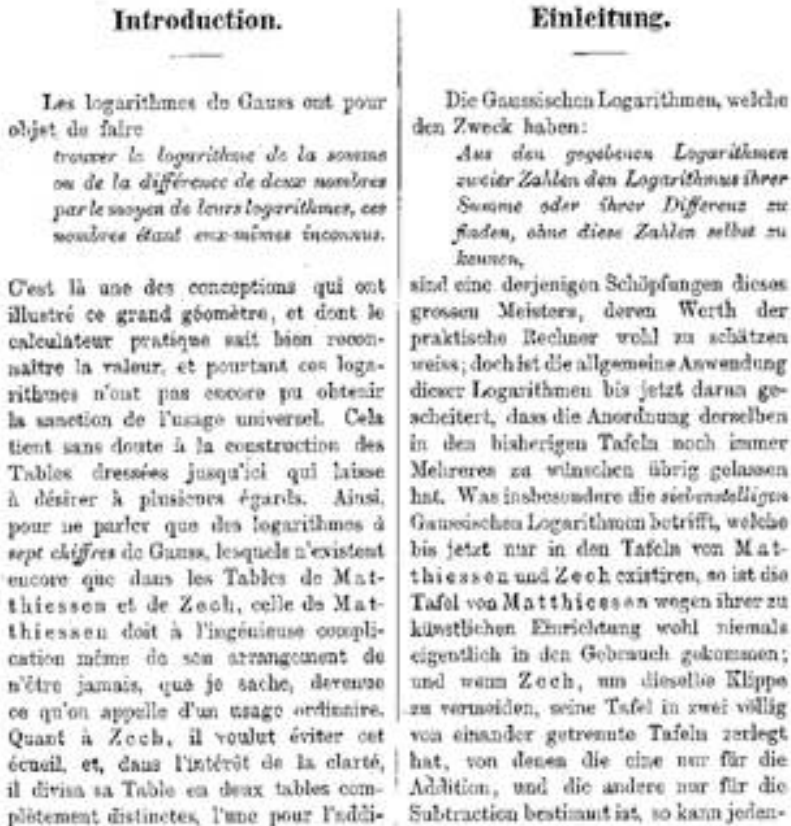
Figura 21. Wittstein 1866, p. VI.

estas tábuas nunca se tornaram realmente divulgadas, como relata Wittstein no prefácio da sua edição: