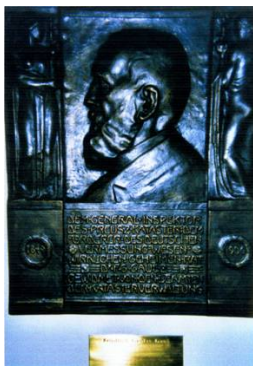
Figura 10. Placa comemorativa F. G. Gauß, município de Bielefeld.

praticamente, todas as províncias da Prússia incitava Gauß a elaborar a tábua dos logaritmos.