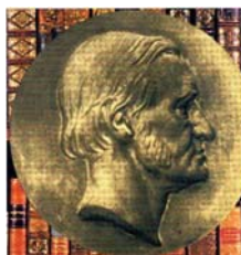
Figura 11. C. F. Gauß (Küssner 1979).

Comparamos agora o retrato desse Gauß com um retrato do outro, “nosso” Gauß: