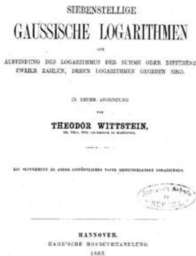
Figura 18. Folha de rosto: Wittstein 1866.

verdade também tábuas de logaritmos pelo próprio Gauß I! Devo admitir que eu mesmo fui surpreendido por isso, porque as tábuas não constam das obras completas dele e eu não as encontrei mencionadas na literatura biográfica. Uma edição tardia das tábuas foi feita por Theodor Wittstein, um matemático de Hanovre, em 1866: