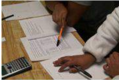
Figura 2. Identificación del movimiento.

(1:02:17) Entrevistador: ¿A qué tipo de movimiento corresponden estos datos?