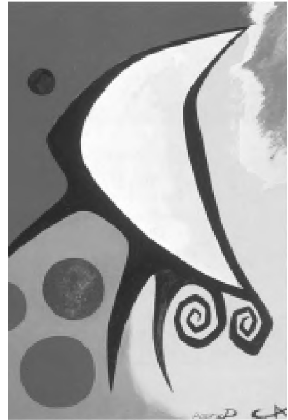
Alexander Calder, Sin título , óleo sobre lienzo, 1950.