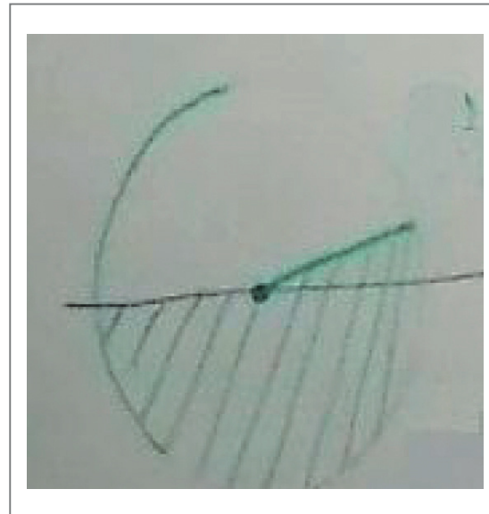
Figura 1. Diagrama circular de los votos de Santos.

con la equidad de género. El profesor explicó en el tablero cómo calcular los grados correspondientes a la circunferencia de acuerdo con la proporción de votos obtenida por cada candidato. Luego el profesor dibujó en el diagrama circular la porción correspondiente al candidato Santos, como se muestra en la figura 1, y pidió a una estudiante que dibujara la porción correspondiente a 70.20° en el diagrama, es decir, la porción del candidato Mockus.