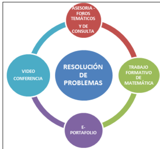
Figura 2. Escenarios e instrumentos que favorecen la competencia de resolución de problemas en un entorno virtual

Pensamos que estos espacios virtuales y herramientas asociadas, configuran escenarios en donde la capacidad de resolución de problemas de los estudiantes se favorece, pues el estudiante transita entre los diversos registros en el sentido de Duval, asimismo permite la interacción docente tutor/estudiante, así como medir sus desempeños y logros en la resolución de problemas.