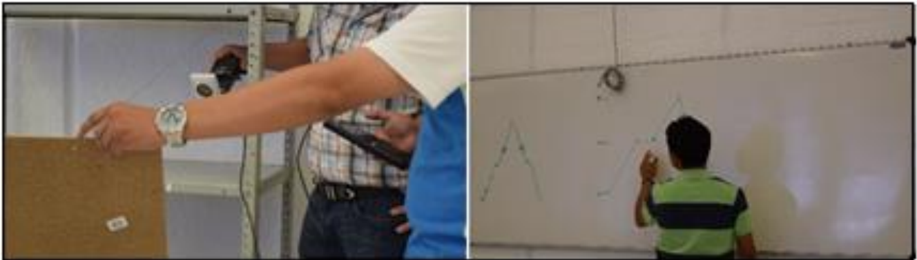
Figura 3. Estudiantes del CAED realizando la situación La hormiga

Cuarto día: Implementaron la actividad seleccionada con estudiantes.