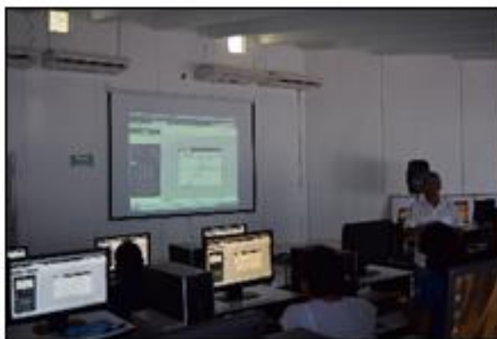
Figura 2. Profesores realizando actividades de modelación y compartiendo su experiencia

Segundo día: Los profesores se enfrentaron a las situaciones de modelación del movimiento, mencionadas anteriormente, y compartieron sus experiencias.