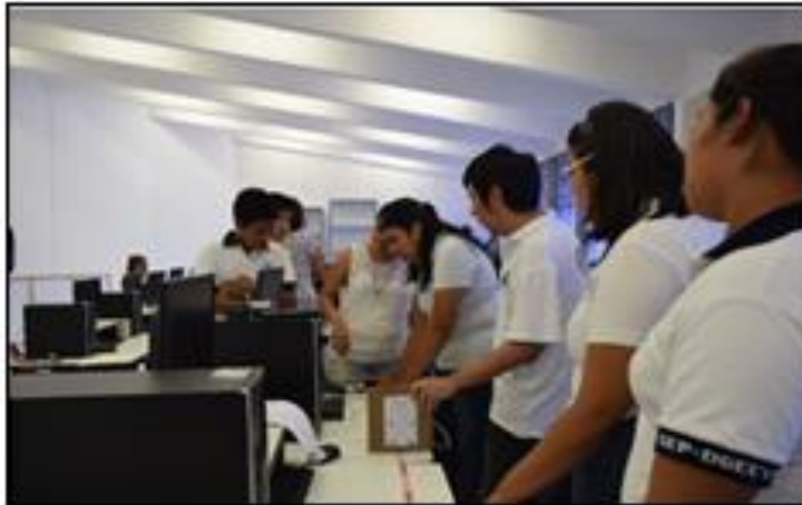
Figura 1. Capacitación sobre el uso de la calculadora

Primer día: Fue fundamental que los profesores experimenten las situaciones, para lo cual se llevó a cabo una capacitación sobre el uso de las calculadoras graficadoras y sensores de movimiento, que estuvo a cargo de un instructor experto en el uso de estos dispositivos.