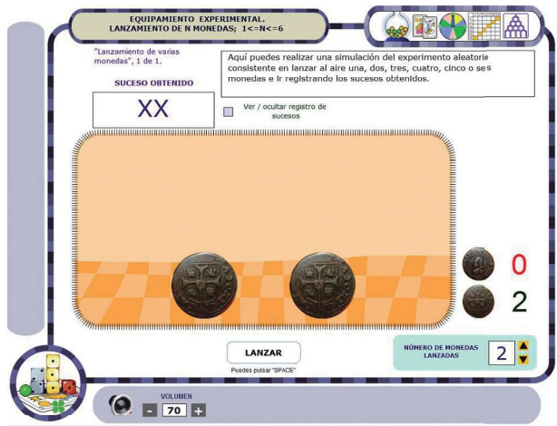
Figura 4. Simulación del problema sobre número de niños y niñas con monedas virtuales

una variedad de simulaciones con diferente material, donde el alumno puede analizar la equivalencia de diferentes experimentos (figura 4).