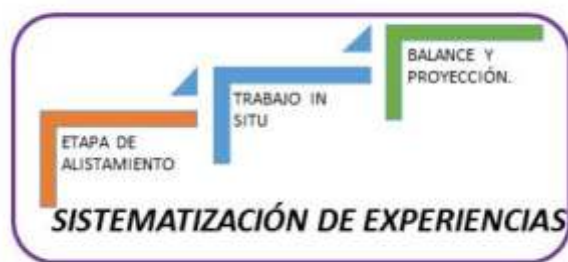
Figura 1. Fases de desarrollo de una propuesta de sistematización en 3 pasos.

“Etapa de alistamiento”; Un segundo momento de tipo práctico y reflexivo denominado “trabajo in situ” en el que a través de tres actividades diferentes se identificará y delimitará una posible experiencia a considerar y un tercer momento que bajo el título de “Balance y proyección”, sugiere a los asistentes, retomar los insumos emanados de la recuperación del relato pedagógico en el aula de matemáticas, con el fin de establecer de manera colectiva qué aspectos pueden ser relevantes para el mejoramiento de la práctica pedagógica en matemáticas en contextos con dinámicas sociales y culturales tan diversas como el colombiano, así mismo proyectar en qué medida, el reconocimiento de los profesionales de la educación del potencial de sus propias prácticas desde el trabajo en el aula puede contribuir en el fortalecimiento de las comunidades en las que se desempeñan.