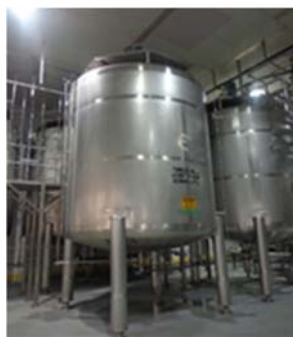
Imagen 1. Tanque cilíndrico vertical con cabezales toriesféricos 80:10.

Después de realizar la investigación correspondiente en la empresa y la bibliográfica, se determina que el tanque es del tipo toriesférico 80:10, por lo cual, el radio del abombado es de 80 % del diámetro de la sección cilíndrica y el radio de esquina o de nudillos corresponde al 10% del mismo diámetro. Estas tapas por motivos constructivos, en México se utilizan como equivalente a las semielípticas 2:1.