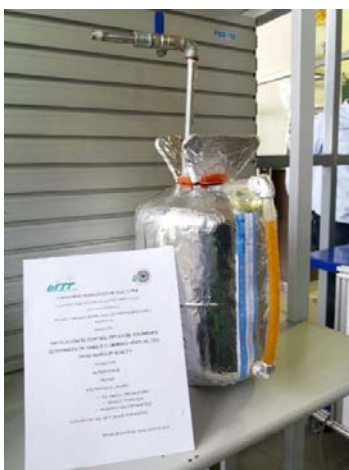
Figura 2: Prototipo de tanque cilíndrico vertical.

F. Análisis de los resultados y/o pruebas a modelos físicos. Cuando no se tiene la posibilidad de manejar un modelo físico, se aplican dos o tres métodos analíticos o gráficos con apoyo de computadora, todo esto para tener la seguridad de que siempre se obtendrá el resultado correcto. En las Figuras 2 y 3, se pueden observar uno de los modelos físicos elaborados por los alumnos del curso de cálculo integral para evaluar la efectividad del método.