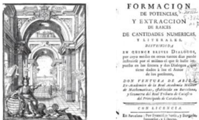
Figura 3. Grabado que abre la obra de Ulloa (izquierda) y portada del libro de Ávila (derecha)

Por último, presentamos un fragmento de la dedicatoria de los Elementos Mathematicos (Ulloa, 1706), obra en dos tomos escrita por el jesuita Pedro de Ulloa y que fue publicada en Madrid en 1706. Este texto es interesante pues se considera como el primer libro español que menciona la geometría analítica de Descartes (Dou, 1990).