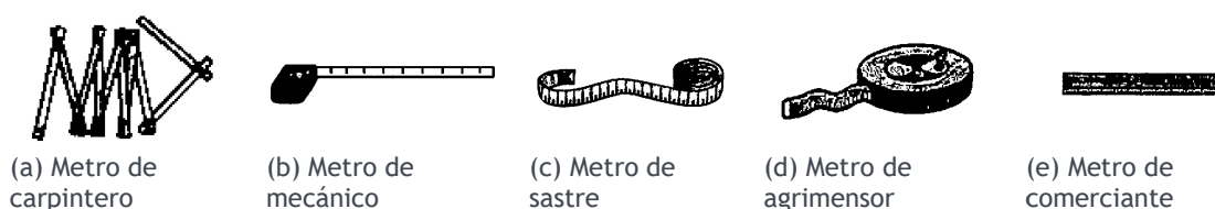
Figura 1. Representaciones del metro en libros de texto (Autor, et al., 1980, p. 130)

Destacan las formas de representar el metro. Durante este periodo predomina la ilustración del metro articulado, con un sistema plegable de diez decímetros cada porción (ver Imagen a, figura 1), una cinta métrica (Imágenes b, c y d; Figura 1) y una vara rígida (Imagen e, Figura 1). Algunos textos resaltan las representaciones gráficas del metro asociadas a diferentes oficios. La figura 1 incluye estas representaciones.