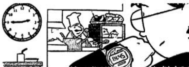
Figura 2. Relojes digital y analógico en los libros de texto (Ferrero, Gaztelu, Martín y Martínez, 2006, p. 61)

(LOGSE) y la cuarta (LOE), consiste en que la primera comienza con los relojes analógicos y después introduce el reloj digital, mientras que en la otra ley se introducen ambos tipos de relojes conjuntamente. En el libro de tercer ciclo LOGSE únicamente se recoge el reloj digital. Si prestamos atención a los descriptores considerados, el reloj se trabaja a través de todos ellos en las diferentes etapas en las que este instrumento está recogido en los libros de la LOGSE y la LOE.