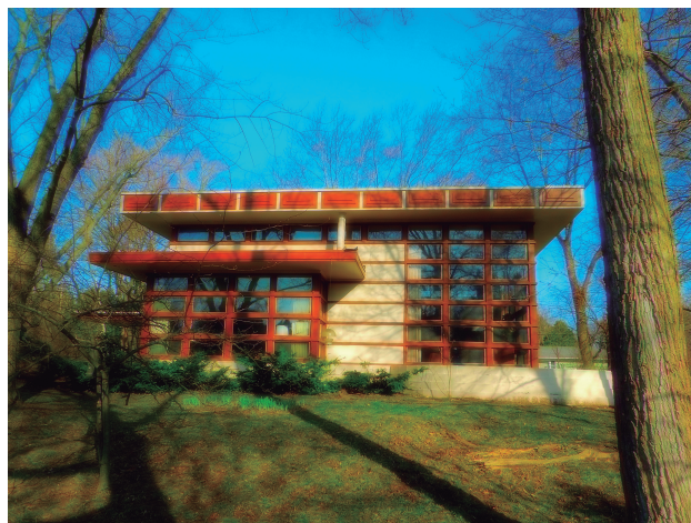
Rudin House