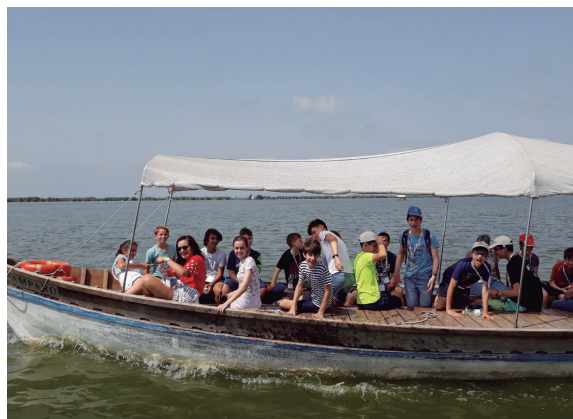
Figura 9. Un paseo por la Albufera

El paseo en barca fue muy agradable, añadido a la información que el barquero iba dando relativa a los orígenes y posterior evolución de la Albufera de Valencia, a la fauna que se podía observar, y a