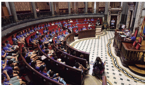
Figura 4. En la sala de plenos del Ayuntamiento

Turia llegamos a la Ciudad de las Ciencias, visitamos el Museo, se hicieron las fotos de las diferentes delegaciones y cogimos un autobús para volver al colegio mayor. Tras la cena, los estudiantes se juntaron por equipos para resolver en común los problemas de la prueba individual y posteriormente exponer la resolución. Tras un día agotador, todo el mundo se fue a descansar.