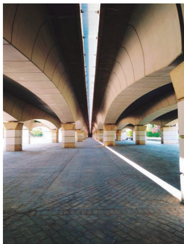
Figura 15. El infinito, los orígenes