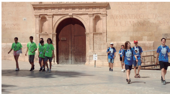
Figura 7. Prueba de equipos

Se trataba de la primera de las pruebas por equipos que planificó la organización: 10 lugares repartidos por el centro histórico tomando como referencia las fuentes de la ciudad, donde los equipos debían resolver las pruebas que se les planteaban. Disponían de un recorrido establecido mediante códigos QR que les geolocalizaba el lugar donde estaba la prueba, y una vez localizado, un panel describía el contexto del lugar y otro código QR daba acceso a la prueba. El