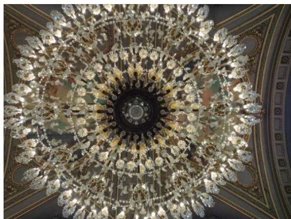
Figura 14. Caleidoscopio simétrico luminoso