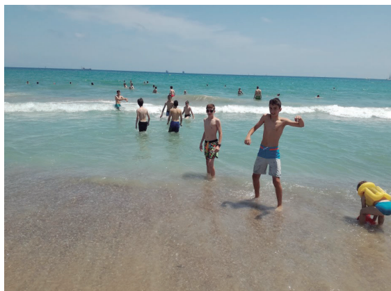
Figura 11. Un baño de refresco en la playa

Una vez hechas las excursiones, nuestro autobús nos acercó al núcleo urbano del Saler, donde nos dejó en un punto estratégico cerca de la playa. Un baño refrescante que nos abrió el apetito y nos permitió conocer esta magnífica playa.