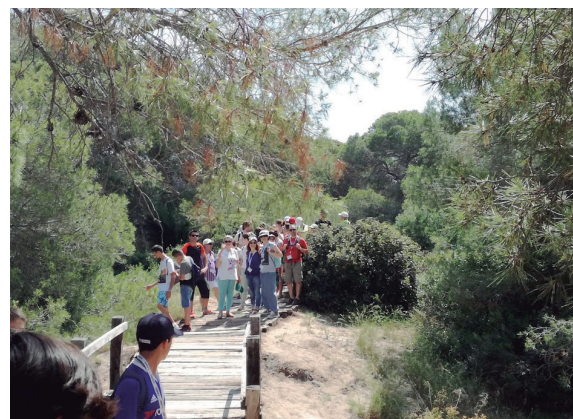
Figura 10. Un paseo por la devesa del Saler

los lugares por los que pasábamos cerca que fueron escenario de películas o series basadas en novelas de Blasco Ibáñez. También fue interesante la visita a la Devesa, donde nos dieron a conocer aspectos de la flora y vegetación mediterránea que nos ayudan a respetar la naturaleza.