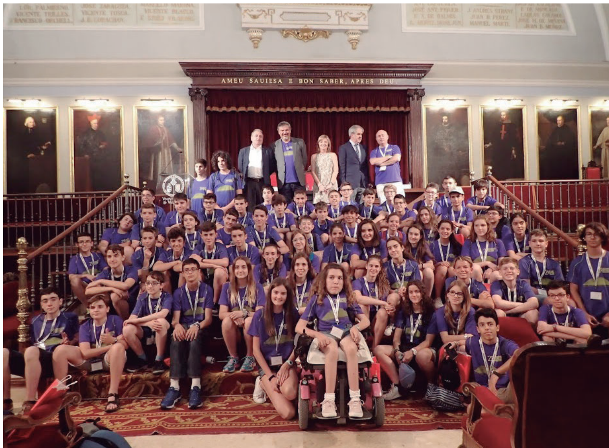
Figura 3. En el paraninfo de la Universidad de Valencia

Turia llegamos a la Ciudad de las Ciencias, visitamos el Museo, se hicieron las fotos de las diferentes delegaciones y cogimos un autobús para volver al colegio mayor. Tras la cena, los estudiantes se juntaron por equipos para resolver en común los problemas de la prueba individual y posteriormente exponer la resolución. Tras un día agotador, todo el mundo se fue a descansar.