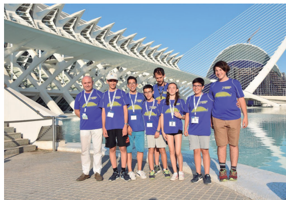
Figura 5. La delegación valenciana