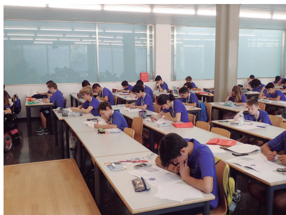
Figura 2. La prueba individual

blemas, donde iban a demostrar sus capacidades individuales. Para el profesorado acompañante el rectorado preparó una visita guiada a diferentes museos de la Universidad Politécnica: el museo de informática, el museo de las telecomunicaciones, y el museo de las estatuas al aire libre. Excelentes las explicaciones de los responsables y muy interesantes las tres visitas.