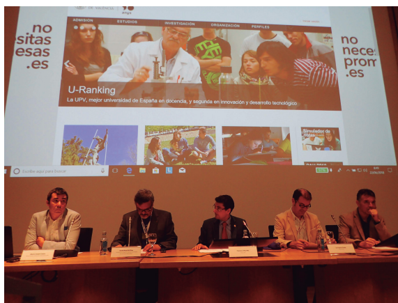
Figura 1. Inauguración