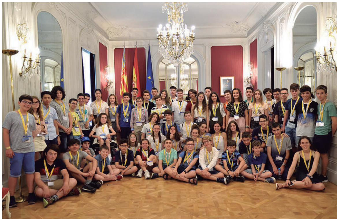
Figura 16. Foto de grupo en las Cortes Valencianas

través de la resolución de problemas, lo cual empieza con el trabajo del profesorado en las aulas, y continúa a lo largo de toda la vida. Los miembros del equipo organizador hemos tenido el punto de mira en los alumnos, siempre con la intención de que disfrutaran de su participación, y que venir a Valencia fuera un regalo en sí mismo. Desde la recepción de las delegaciones hasta el día de la partida, hemos estado pendientes de que todo lo necesario estuviera a su disposición. El comportamiento e implicación de todos los estudiantes ha sido ejemplar, lo cual confirma el excepcional perfil personal de los estudiantes. Enhorabuena a todos.