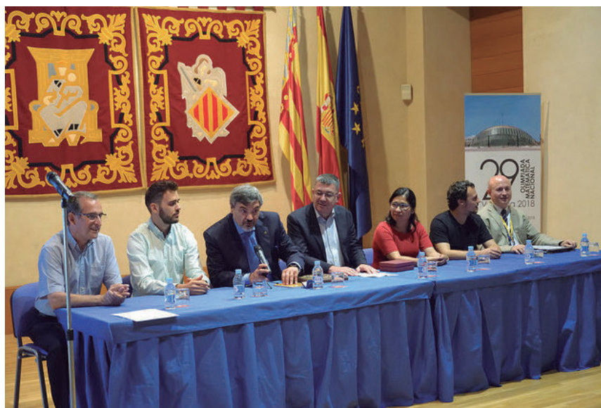
Figura 12. Clausura en las Cortes Valencianas

UXIA SIERRA ROUCO de Galicia, por la fotografía El infinito, los orígenes .