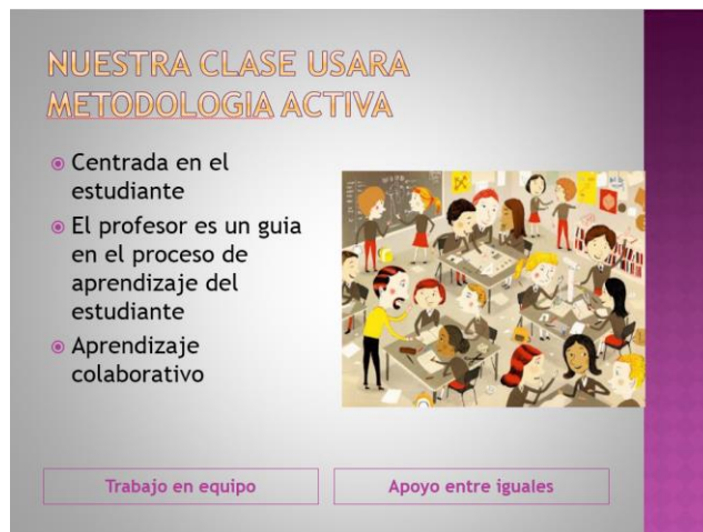
Figura 1. Diapositiva dentro de la presentación del primer día de clase

Reconocemos que nuestros estudiantes vienen a nuestros cursos con una expectativa basada en sus experiencias en cursos anteriores. En algunos casos estos ya han trabajado en entornos virtuales o en cursos diseñados por competencias. Otros están acostumbrados a la pasividad habitual de muchos cursos típicos de matemáticas. En los primeros cursos en los que se intentó implementar esta metodología en ocasiones los estudiantes querían volver al esquema pasivo, argumentando no poder hacer las cosas. En el grupo que presentamos aquí los resultados, se hizo especial énfasis en que nuestro curso sería diferente. Además de las presentaciones por parte de los estudiantes y del profesor, se hace una presentación en diapositivas donde además de mostrar el objetivo del curso, el programa y la manera en que serán evaluados, se hace hincapié en cómo se trabajará en clase. En la figura 1 se ve la diapositiva en donde se expresa y se muestra por medio de una imagen la situación en que se verán cada día: los estudiantes interactuando entre sí y con el profesor. En nuestra experiencia, la diapositiva con la imagen mostrada al inicio del curso ha colaborado a que el curso se desarrolle bajo este nuevo esquema y sin ninguna petición por parte de los estudiantes de volver al esquema pasivo.