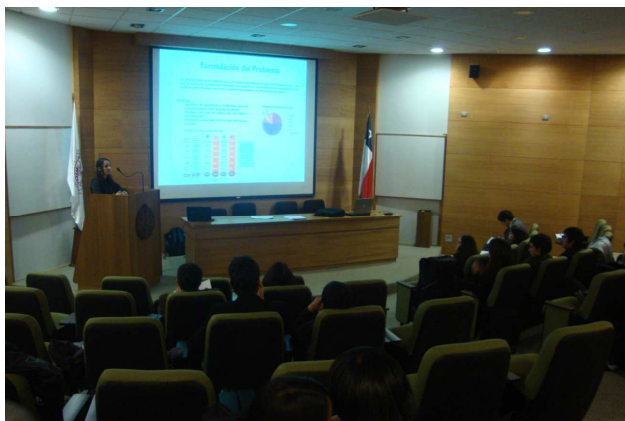
Figura 2. Presentación de uno de los trabajos finales del curso

El tipo de evaluación es la habitual que lleva el profesor de los aprendizajes de sus estudiantes (heteroevaluación) y la evaluación entre los estudiantes de una actividad (coevaluación). La tabulación se realizó mediante la escala de valoración en los distintos ítems para cada trabajo. La evidencia de esta actividad está en correspondencia con los resultados de aprendizaje (RA) 1, 2 y 3. Se observa en la Tabla 4 que en general las presentaciones de defensa de los trabajos fueron buenas, destacando la apropiación e interés de temas propio de la ingeniería como son el análisis químico de suelos y estudio de caudales de ríos. Hubo un buen nivel en el discurso y fluidez de los temas y uso del lenguaje estadístico, sobre todo en el análisis de datos mediante estadística descriptiva alcanzando un 86% de logro de aplicación de estos elementos metodológicos (RA1). Se obtuvo un 74% de aprobación por los pares evaluadores (coevaluación) en el uso adecuado del lenguaje en el tema de la inferencia estadística (intervalos de confianza y pruebas de hipótesis), y de un 81% en su correcta aplicación (RA2). Todos usaron la informática (RA3). Los estudiantes calificaron con un 88% la claridad de exponer las hipótesis de investigación y su transformación a hipótesis estadística. De los 17 trabajos expuestos un 71% declaró los objetivos pretendidos en los respectivos temas. Éste es un punto que hay que trabajar con los estudiantes en esta asignatura.