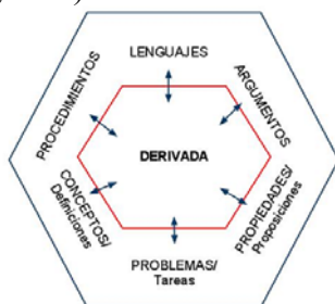
Figura 3. Objetos intervinientes en las prácticas de las cuales emerge la derivada

De esta forma, como hemos mencionado, una primera fase de nuestro proyecto de investigación consistió en realizar una reconstrucción del significado epistémico global de la derivada , para lo cual nos hemos apoyado en la noción de configuración epistémica (CE) que nos proporciona el EOS. Dicha noción nos permitió reconstruir el significado global de referencia mediante la identificación de los significados parciales de la noción de derivada, a partir de los informes de investigación y documentos históricos del cálculo infinitesimal. Esto consistió en identificar y describir de manera sistemática, los objetos primarios (situaciones, lenguajes, conceptos, propiedades, procedimientos y argumentos) intervinientes en los sistemas de prácticas de los cuales emerge el objeto derivada (figura 3).