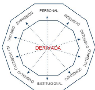
Figura 4. Facetas duales desde la que se pueden ver los elementos de cada configuración

Además, en el análisis de las configuraciones epistémicas, cada uno de los objetos intervinientes puede verse desde las distintas facetas duales que propone el EOS, razón por la cual estuvieron presentes en nuestro análisis. La figura 4 resume dichas facetas duales.