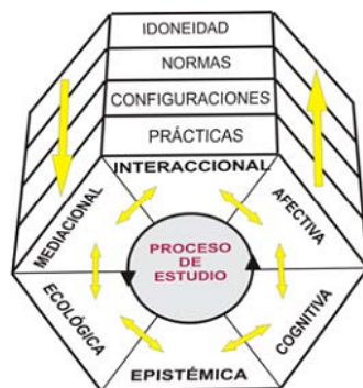
Figura 2. Facetas y niveles del conocimiento del profesor (Godino, 2009, p.21)

En la Figura 2 se puede observar cómo interactúan las facetas y los niveles del conocimiento del profesor que acabamos de describir.