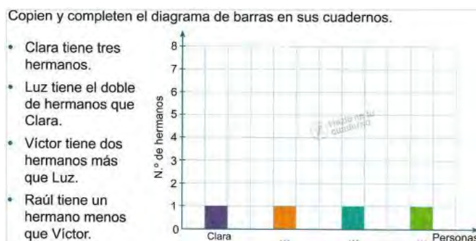
Figura 2. Actividad de completar (T3, p. 77)

Completar. Se pide terminar la construcción de un gráfico, con la información proporcionada en un listado de datos o una tabla. En el caso de la actividad de la Figura 2 implica construir barras, escribir un título general y los rótulos de las categorías del eje X en el gráfico.