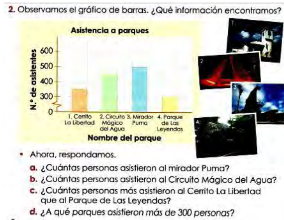
Figura 1. Actividad de leer (T2, p. 169).

desarrollo de otras, como paso necesario. Para esta categoría se ha considerado solo las que permiten dar una respuesta directa a la pregunta. Por ejemplo, en la Figura 1, pregunta b , se pide responder cuantas personas asistieron al Circuito Mágico del Agua.