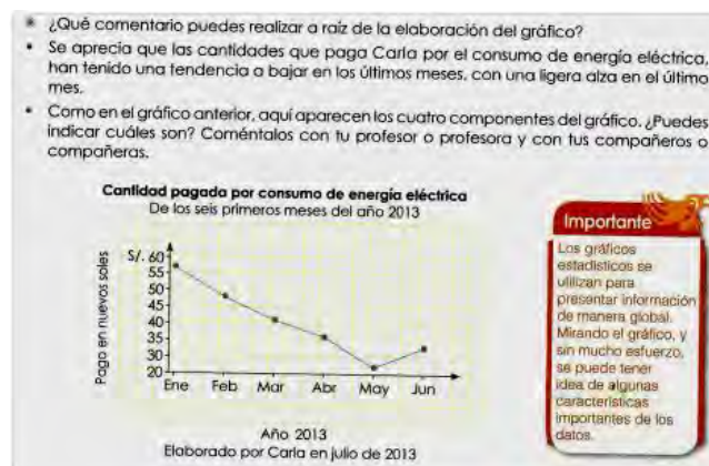
Figura 5. Actividad de ejemplificar (T6, p. 184)

Ejemplificar. Es una actividad que demuestra, aclara o muestra la interpretación, análisis y/o construcción de un gráfico; mostrando al estudiante la elección del mejor gráfico, en descubrir las semejanzas/diferencias entre ciertas representaciones, así como las ventajas o desventajas en el uso de las mismas. Un ejemplo de esta actividad la encontramos en la Figura 5, donde se muestra la forma de interpretar un gráfico de líneas, al observar la tendencia de la cantidad pagada del consumo de energía eléctrica.