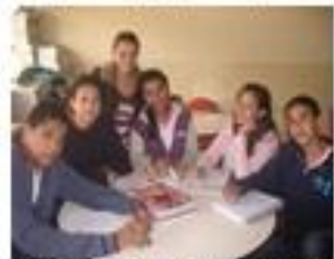
Imagem 4 - Alunos e professoras analisando sugestões