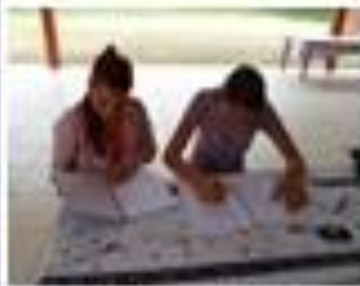
Imagem 1 - Sugestão de material didático

A experiência foi realizada com cinco alunos entre 12 e 14 anos de idade que cursavam o 9º ano do ensino fundamental, em horário extracurricular, durante seis encontros. Para a experiência foram utilizadas atividades diagnósticas, situações-problema, explicações do conteúdo e atividades que propiciaram as deduções de fórmulas e culminando numa planilha final. Durante o processo supracitado, houve mediação das professoras sanando dúvidas através de discussões, para que os alunos expressassem oralmente e textualmente seus avanços e suas dificuldades.