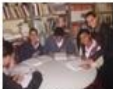
Imagem 2 - Mediação de professoras