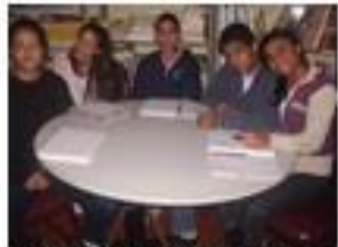
Imagem 3 - Alunos que participaram de sugestões

Em síntese, as atividades desenvolvidas mostraram que o ensino de Matemática Financeira, apoiado na resolução de problemas, possibilita aprendizagens significativas.