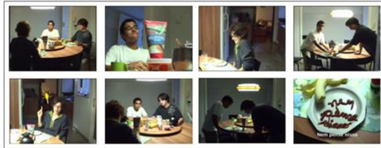
Exemplo de propaganda em vídeo.

um minuto. Julgamos muito importante alertar aos alunos que optarem pelo vídeo que façam um pré-teste no computador que irão utilizar no dia da apresentação para não terem surpresas na hora da sua exibição.