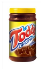
Exemplos de embalagens “muito comuns”.