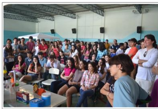
Apresentação para a escola.