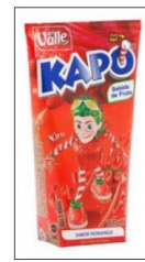
Exemplos de embalagens “exóticas”.