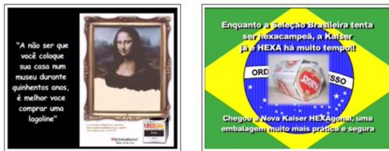
Exemplos de propagandas estáticas (cartazes).