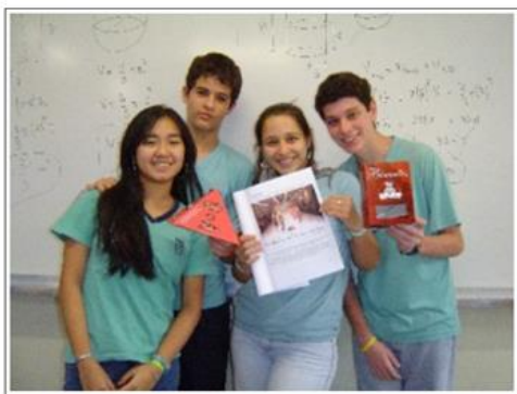
Apresentação em sala - Embalagem Grife do Sabor.

Após a apresentação em sala de aula, preparamos a apresentação externa, onde serão exibidos a comunidade escolar os trabalhos desenvolvidos pelos alunos durante o ano.