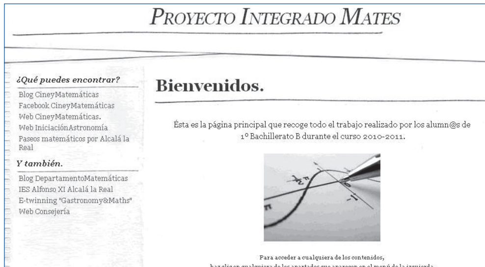
Figura 1. WebProyectoIntegrado

Después de pasar algunos días recopilando ideas que llevar a cabo durante el año en la materia, me decidí finalmente por desarrollar en él un triple proyecto. Esto es, un proyecto distinto para cada trimestre. Esto supuso, un trabajo de planificación y organización importante pero a la vez, hizo la materia más divertida, interesante y amena. Así, en el primer trimestre, realizamos un proyecto titulado “ Cine y matemáticas ”, en el segundo trimestre, un proyecto titulado “ Iniciación a la astronomía ” y en el tercer trimestre, el proyecto estrella, de título “ Paseos matemáticos por Alcalá la Real ” en el cual nos centraremos a partir de ahora. No obstante, os invitamos a visitar el portal diseñado para la materia donde podréis ver el trabajo llevado a cabo en cada uno de los proyectos en cada trimestre https://sites.google.com/site/proyectointegradomates/