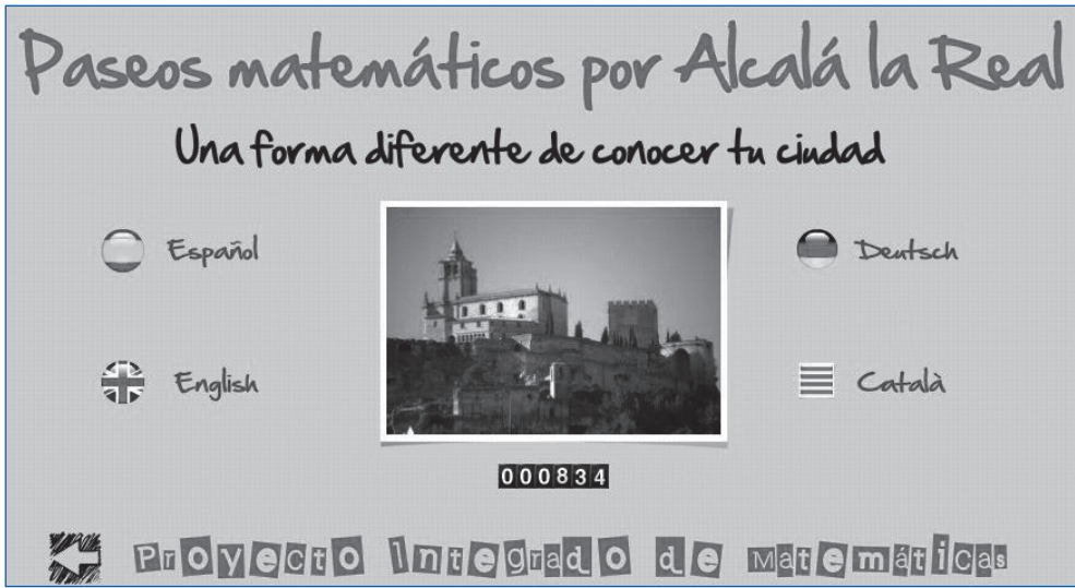
Figura 3. WebPaseos

alumna alemana que había venido de intercambio, el interés de un chica catalana y de las ganas de colaborar del profesor de inglés que impartía proyecto integrado de dicha materia nos decidimos a traducir nuestro trabajo, en su mayor parte, a varios idiomas. Todo lo comentando anteriormente se puede ver en la web que diseñamos y que se puede acceder desde la dirección http://www.wix.com/proyintea1fonso11/paseosmaticos