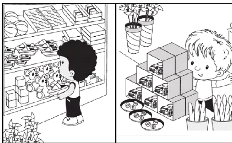
Figura 6. Niños en una juguetería.

proporciona respuestas estimadas a situaciones contextuales que no admiten respuestas definidas. Por supuesto, esto presume imponer metodologías de investigación particulares para determinar la verticalización alcanzada a medida que tales modelos descriptivos se convierten en modelos prospectivos. En esta situación, la matematización del proceso de estimación debe separarse de la matemática vertical que se deriva del modelo determinístico original. A continuación presentamos algunos ejemplos para ilustrar el punto.