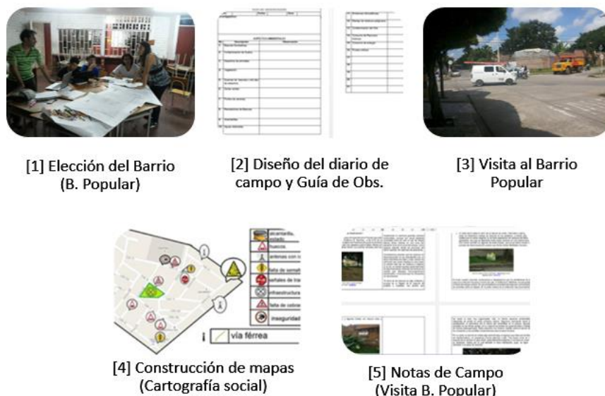
Figura 2. Extractos de diarios de campo de la investigación realizada

Adicionalmente, una vez constituido el GIAP se realizó un primer trabajo de campo, para lo cual se siguió la siguiente ruta metodológica: