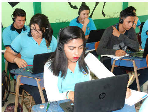
Figura 3. Grupo de estudiantes de secundaria realizando un módulo del curso PGB