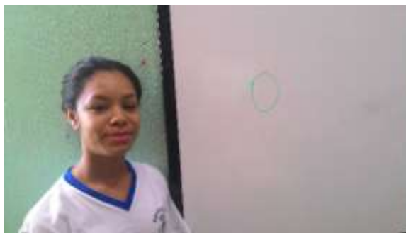
Figura 01: O algarismo zero representado por uma estudante no quadro.

A estudante escreve na lousa o número zero (0), o pesquisador afirmou estar feliz ao ver que eles conseguem tal representação com facilidade, todos se olham sem entender. Iniciou-se então a narração do conto, o pesquisador expressou na lousa o número zero utilizando apenas o algarismo quatro, da seguinte forma 44-44 = 0 , houve um espanto, o pesquisador complementou afirmando que tudo na Matemática deve ter significado, sentido, e não apenas fórmulas por fórmulas. O objetivo era deixar claro que podemos chegar ao mesmo resultado de formas diferentes conforme figura 01.