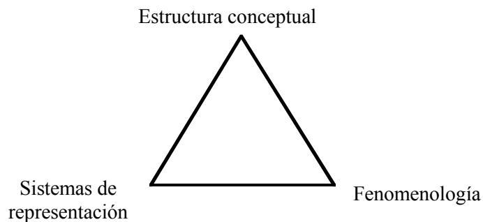
Figura 2. Triángulo semántico de un concepto matemático escolar

Este triángulo semántico identifica los elementos constitutivos del significado de un concepto desde una perspectiva lógica y formal. Nuestro interés por el significado está centrado en el ámbito de la matemática escolar; por ello adaptamos estas ideas a nuestro propósito y abordamos el significado de un concepto matemático en dicho ámbito atendiendo a tres dimensiones: los sistemas de representación, la estructura conceptual y la fenomenología (Rico, citado por Gómez, 2007, pp. 23-27).