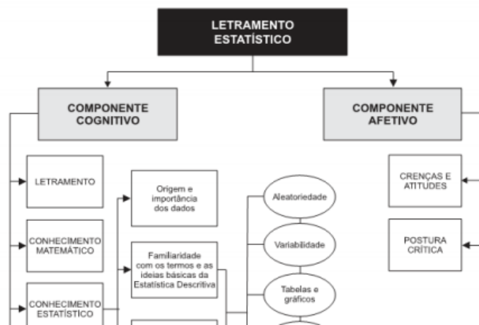
Figura 1 – modelo de letramento estatístico de Gal (2002)

O letramento estatístico é definido por Watson (1997) como a capacidade de compreensão de textos e das possíveis implicações dos dados estatísticos em contextos distintos, onde envolve simultaneamente a linguagem e os conceitos, assim como o desenvolvimento de atitudes investigativas e críticas. O modelo indicado pela figura 1 ilustra como melhor esses componentes estão relacionados entre si: