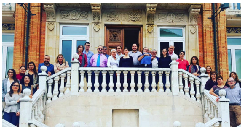
Figura 1. Asistentes al seminario federal en la sede del CIEM de Castro Urdiales