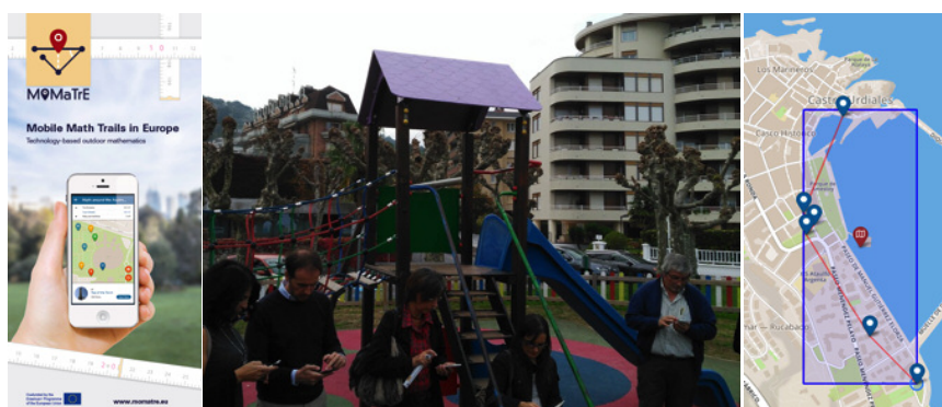
Figura 7. Participantes del seminario diseñando una ruta matemática por Castro Urdiales

Las rutas así generadas pueden jugarse desde la aplicación para dispositivos móviles, pudiendo empezar por cualquiera de los puntos que las componen. Es una aplicación muy bien diseñada, con una interfaz sencilla y que puede dar una vuelta de tuerca a las rutas matemáticas. En la web de la aplicación hay tutoriales de uso y se amplía toda esta información.