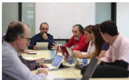
Figura 8. Grupos en plena sesión de trabajo