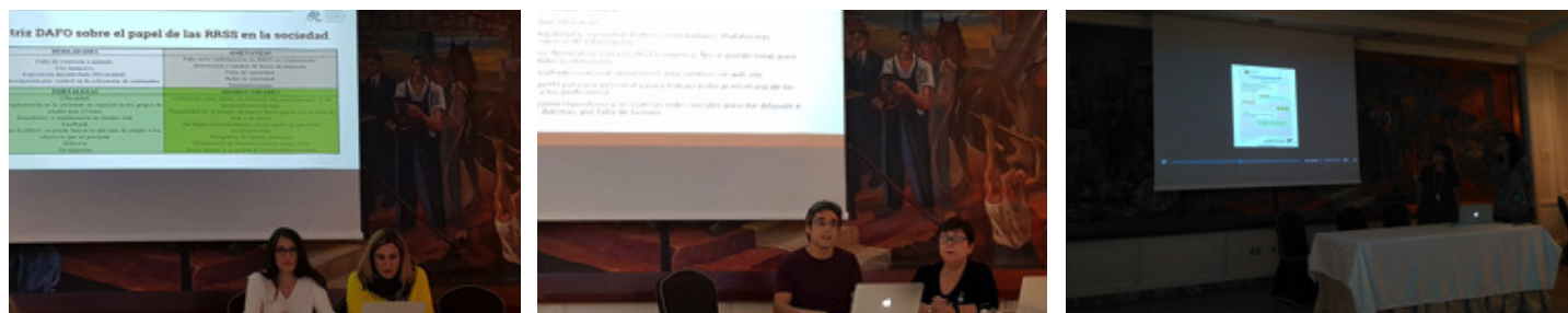
Figura 9. Última sesión del seminario: presentación de las conclusiones de los tres grupos de trabajo