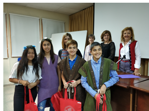
Ganadores de la edición anterior