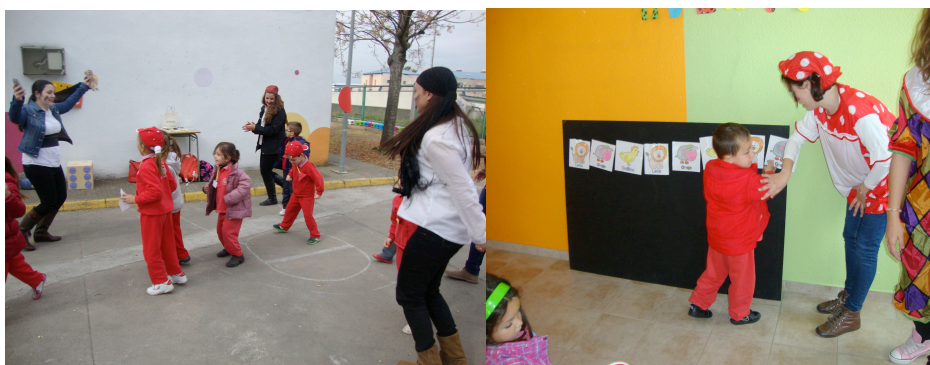
Figura 2. Todos participan en los juegos.

Ya en la Casita, tanto los niños como los futuros maestros disfrutaron realizando los juegos y acercándose a las matemáticas desde un enfoque más intuitivo y no formal.