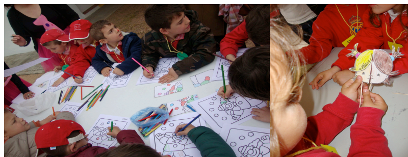
Figura 4. Coloreando y formando la figura