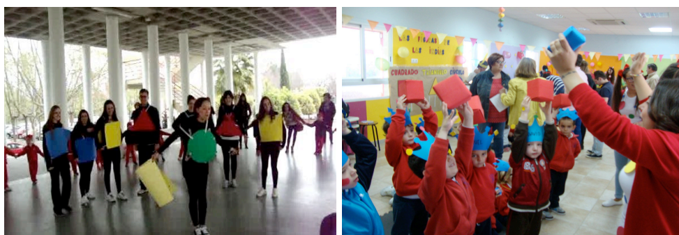
Figura 1. Recibimiento: jugando con las formas geométricas

Cuando llegaron los niños a la Facultad, lo primero que se hizo fue realizar unos juegos-actividades de psicomotricidad en las que se jugaba con las formas geométricas (figura 1).